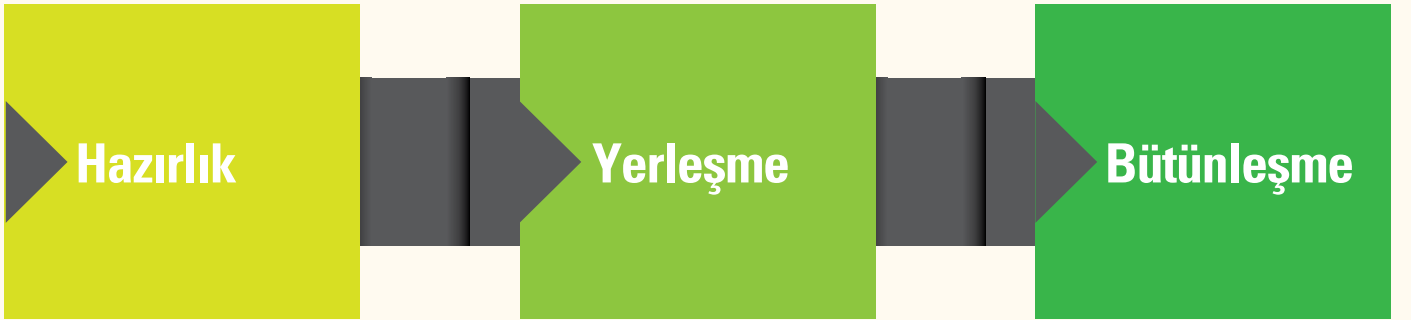
Őekil 2. Okula Uyum Aőamaları

Okula uyum; çocuk, aile ve okulun birlikte çalıştığı devamlılık gösteren ve farklı aşamalarda gerçekleşen, bir süreçtir.